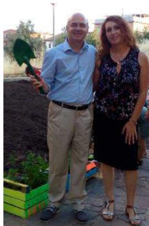
(W. Deitinge e C. Messeri)