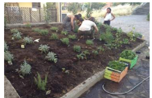
(l'orto è ..... davvero storto)