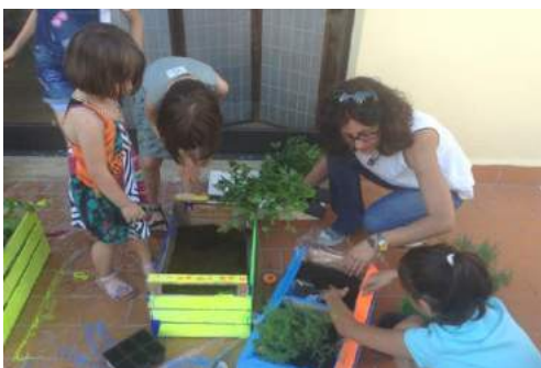
(grande e ..... piccini all'opera)

" L'Ambiente è lo spazio dell'avventura umana: spazio aperto ad infinite possibili ricerche e scoperte, spazio in cui l'esistenza dell'uomo si realizza e rischia continuamente di perdersi" (tratto dal Manifesto per l'educazione all'ambiente - Torino, luglio 1988)